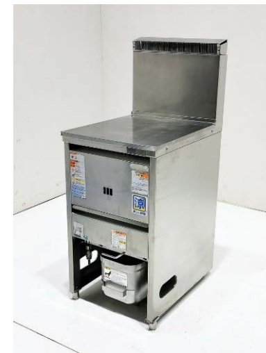
床置きフライヤー