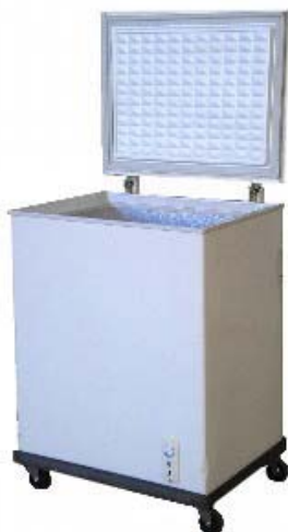
アイスストッカー