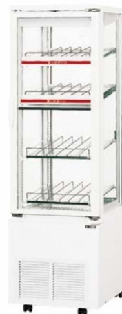
4面冷蔵ショーケース