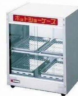
ホットショーケース